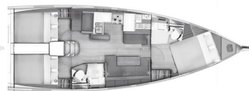
Versione D Cabina armatore a prua 2 cabine poppa / 2 bagni