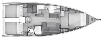
Versione C Cabina armatore a prua 2 cabine poppa / 1 bagno (Guardaroba + mobili con lavabo privato en cabina prua opzionale)