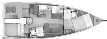
Versione B Cabina armatore a prua 1 cabina poppa / 2 bagni