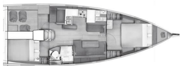
Versione A Cabina armatore a prua 1 cabina poppa / 1 bagno (Guardaroba + mobili con lavabo privato en cabina prua opzionale)